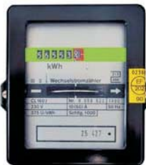
Zählt weniger als je zuvor