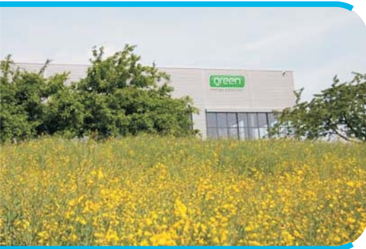
Firmsitz in Ehringshausen